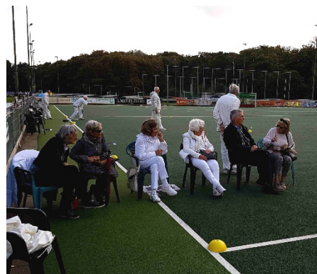
Het toegestroomd publiek