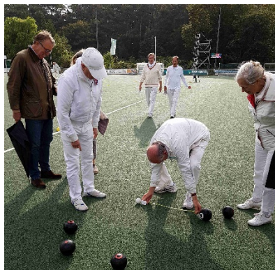
Metten is weten