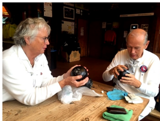
Poetsen mocht niet helpen